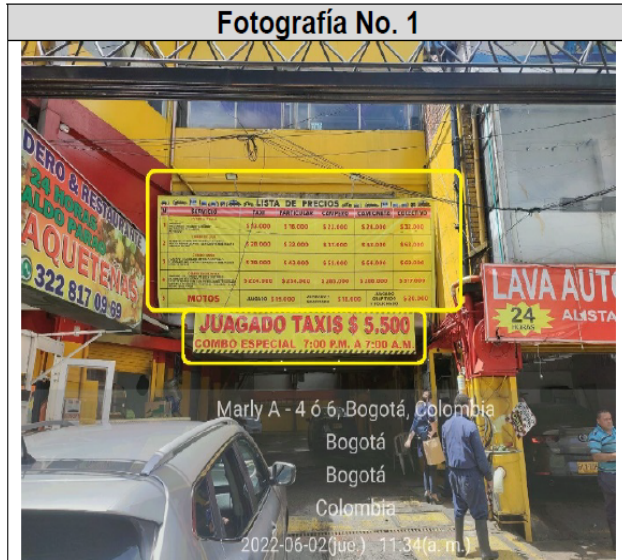
Fotografía No. 1. Fachada del establecimiento (AK 14 NO. 49 - 52), se evidencia dos (2) avisos en fachada del establecimiento.