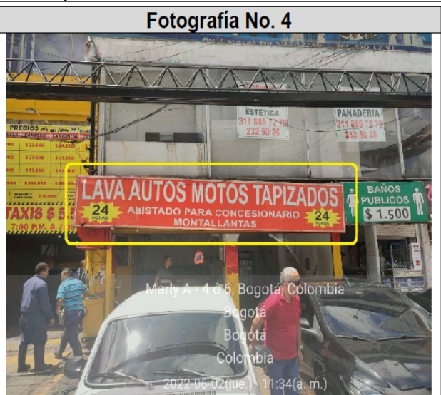
Fotografía No. 4. Fachada del establecimiento (AK 14 NO. 49 - 52), se evidencia un (1) aviso en la fachada del establecimiento.